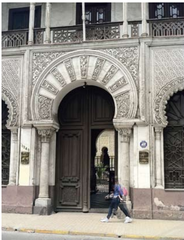
Palacio de La Alhambra de Santiago, declarado monumento nacional en 1973.

Comencé estos reportajes como una suerte de tour caprichoso, aleatorio e informal sobre el backstage de París que me tocaba vivir. Este también es un tour, caprichoso y aleatorio, pero esta vez a través de otro tipo de geografías, hablo de esas geografías desconocidas que aparecen cuando se investiga... sinceramente. Y de como sorprendentemente van apareciendo universos, conceptos, personas, situaciones, reflexiones, que van respondiendo paso a paso a cada nueva incognita que se presenta.