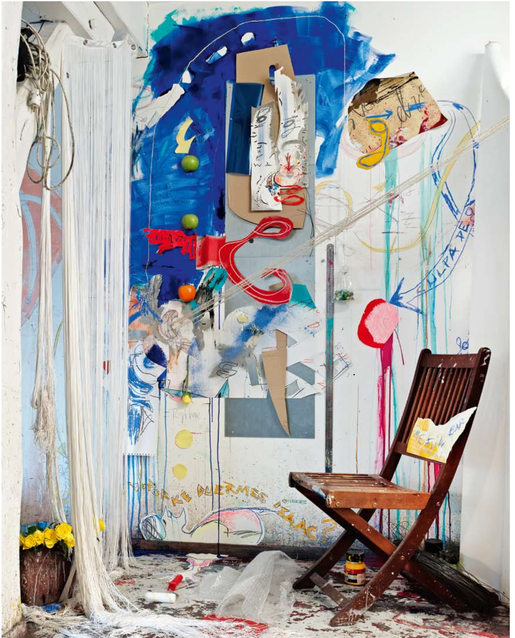
Puesta en escena silla pilar muro "reflexiones lúdicas sobre la gravedad, la ciudad el transporte e isaac newton" instalación Leo Godoy Muhsam.